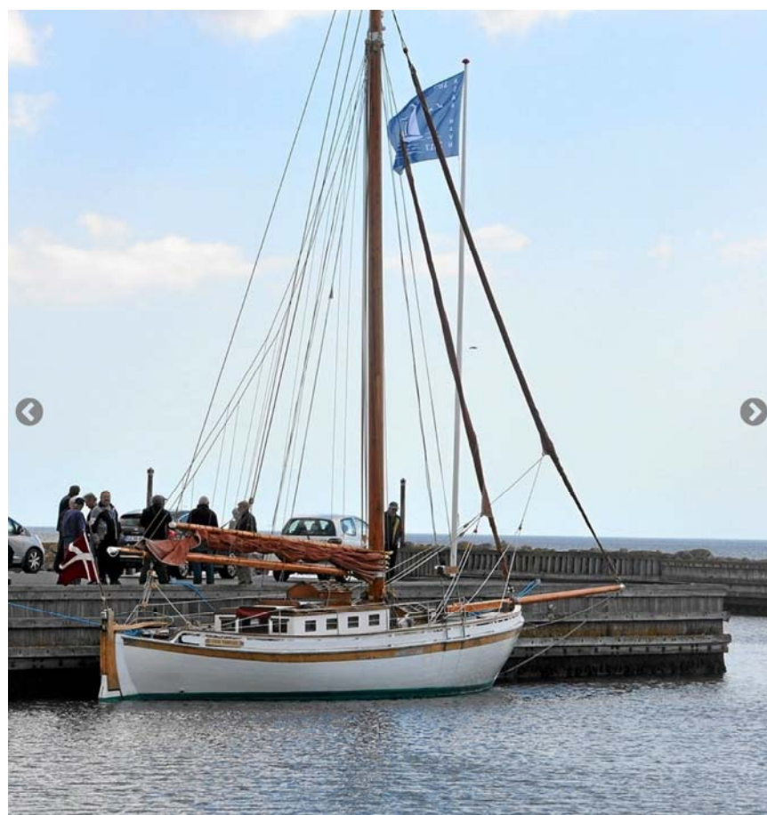
Man kan vel godt sige, at den flotte båd af typen Colin Archer var på besøg i sin "fødeby", hvor interessen for den var stor.